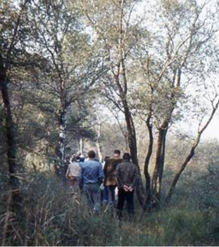
Achter de gids aan

Dit tegelijkertijd met de viering van het toen ook 100-jarige bestaan van Café Beneman. Met die sloop en nieuwbouw verdween een stukje nostalgie, waaraan eenieder die in dat oude café is geweest, met weemoed terug zal denken.