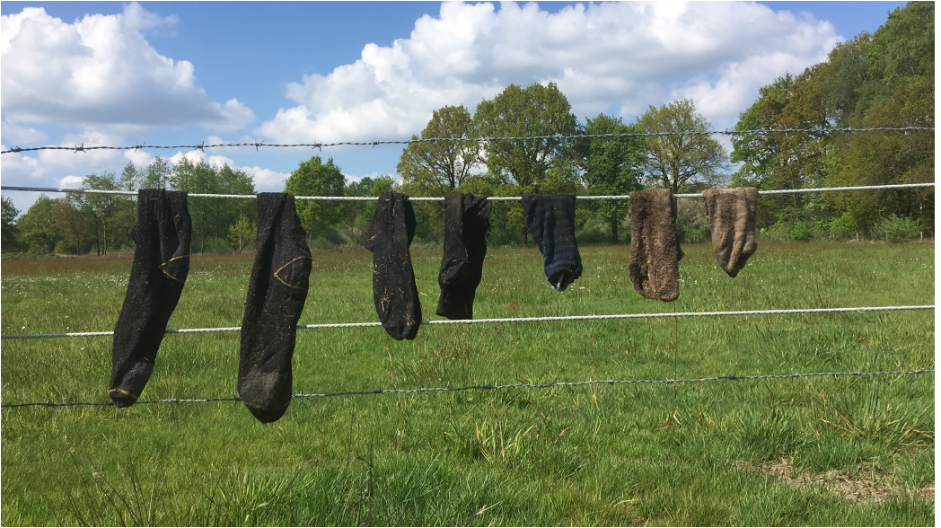
Natte sokken halen in het veen.