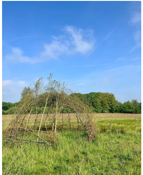
Wilgenhut in de bufferzone.

ook op een later moment heeft de zaagploeg het hek nog verder gebouwd zodat onze ontmoetingsplek nu nog beter zichtbaar is. Wij zijn blij hoe goed de takken door al de regen zijn uitgegroeid, het resultaat mag er zijn. Op de foto's zijn de poort en de hut te zien hoe ze in mei dit jaar erbij stonden. Volgend voorjaar kunnen we de bouwwerken nog verder aanvullen en/of uitbreiden, maar voor nu staan ze alvast mooi uit te blinken. Ook gaan er nog weer wat boomstammen verdeeld worden zodat we weer een paar natuurlijke zitgelegenheden hebben.