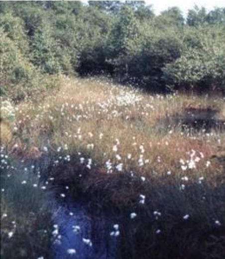
Veenpluis en water