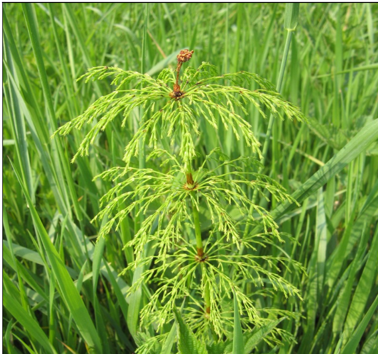
Bospaardenstaart in de bufferzone