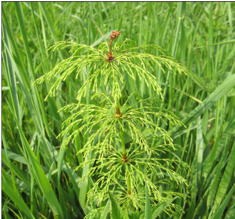
Bospaardenstaart in de bufferzone