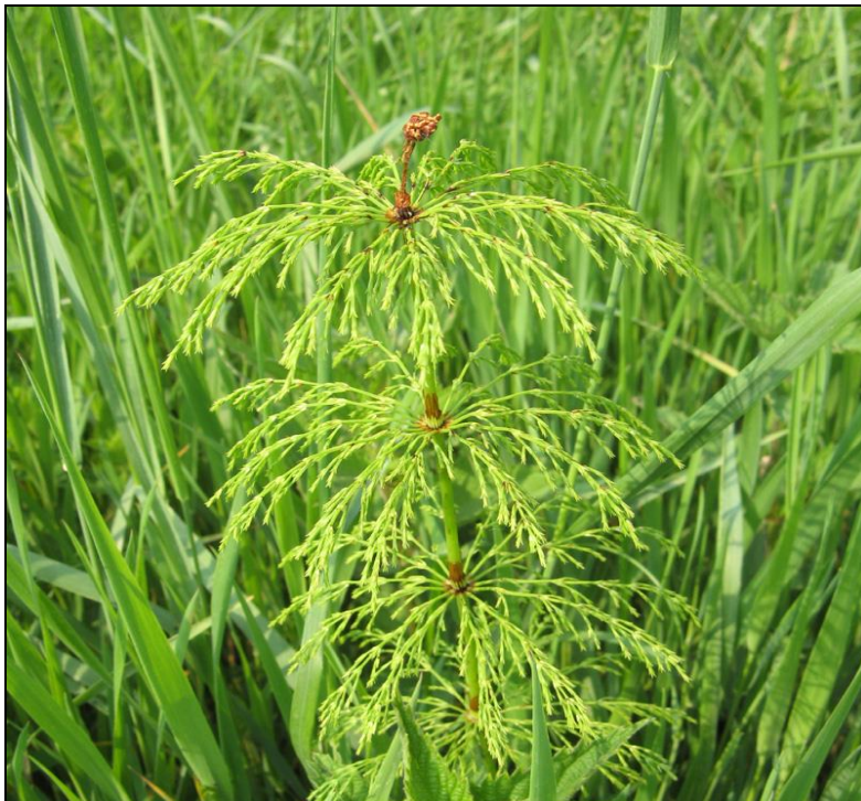
Bospaardenstaart in de bufferzone