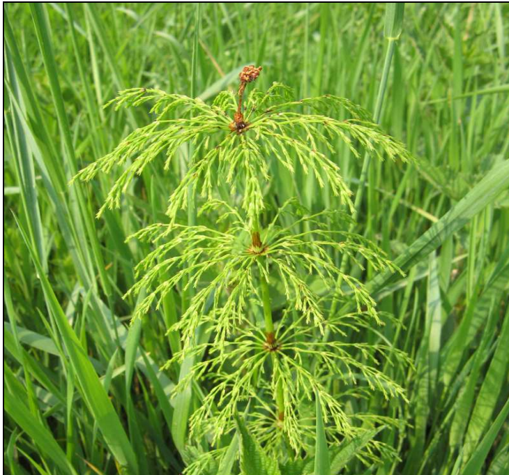
Bospaardenstaart in de bufferzone