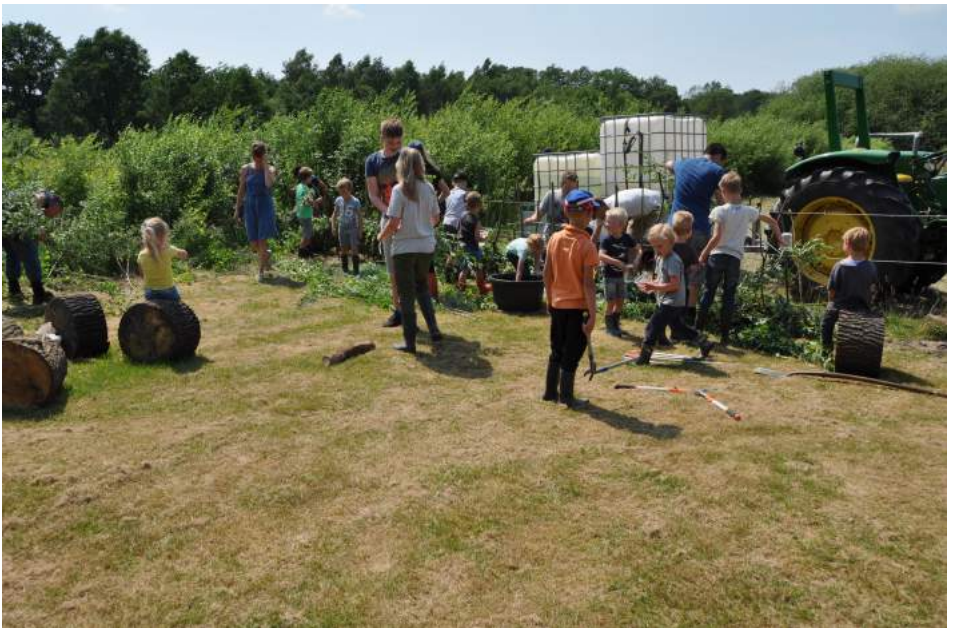
Aan het natuurwerk

wilgentent bouwen, waarin wij met z'n allen op boomstammetjes kunnen zitten en de volgende avonturen kunnen bespreken. Tevens zal dit plekje ook van de Vaene(k)wakers van de Antoniuschool in Vragender zijn die ook geregeld het veen intrekken voor praktijkonderwijs. Door kinderen al op jonge leeftijd op een speelse manier kennis te laten maken met ons mooie veen, hopen wij dat een aantal van hen zich in de toekomst wil gaan inzetten voor het behoud van een uniek stuk levend hoogveen. Terwijl een afwisselende groep hard aan het werk was met het opzetten en vlechten van het