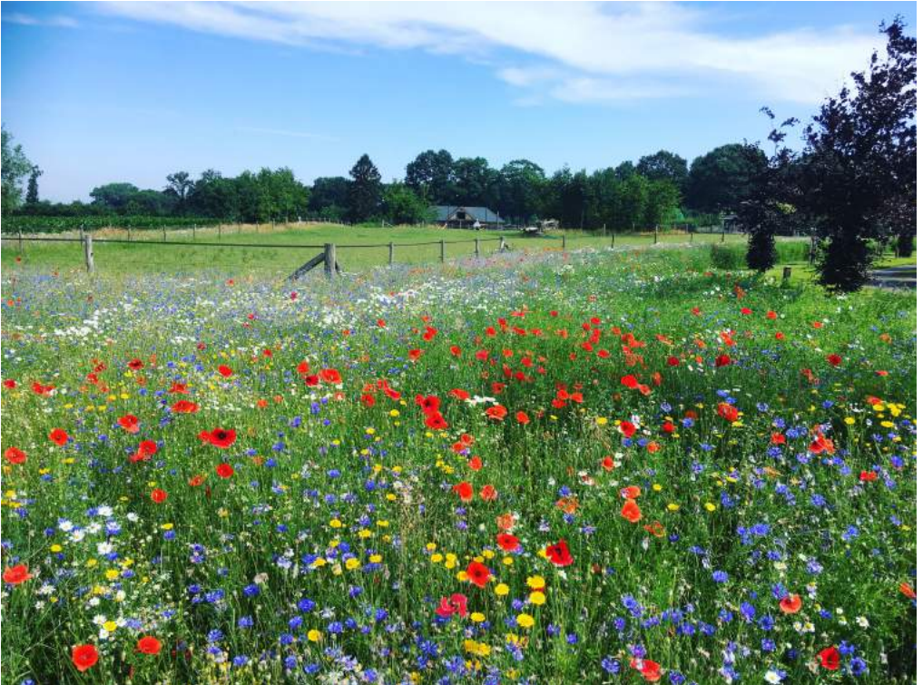
Akkerranden bij Aalten