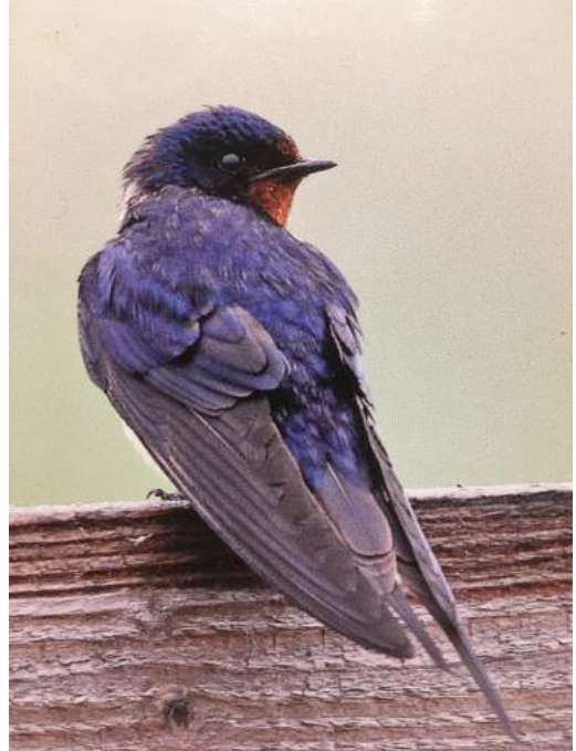
Boerenzwaluw