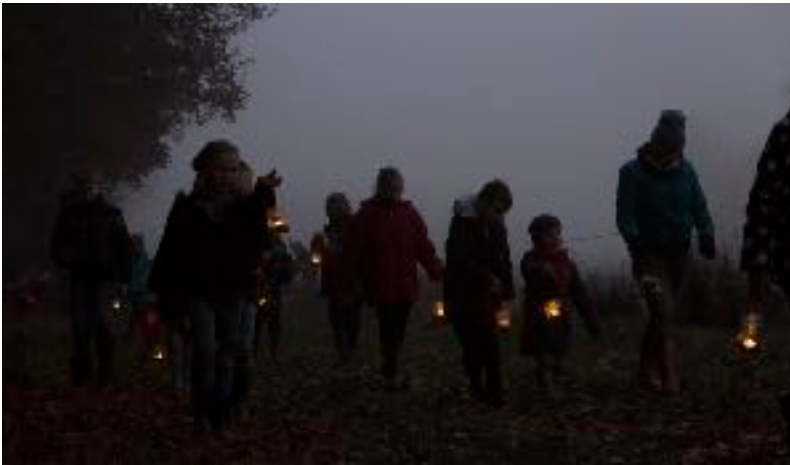
Ook 's avonds gaan de junioren op pad

Ik heb de hele middag een grijns op m'n kop gehad. Met een groep van 26 kinders tussen de vier en twaalf (als ik het goed heb) gingen we op pad. Vanaf de parkeerplaats bij het veen in Vragender, liepen we langs de rand van het veen door de bossen. "Zoek allemaal maar eens mooie bladeren en eikels" was de opdracht die Frans gaf. Samen met een aantal begeleiders