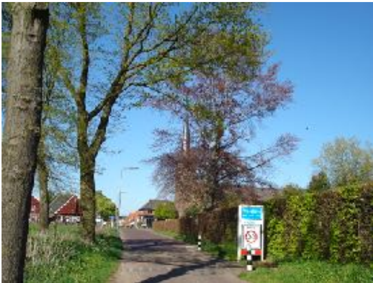
De Heelweg in Vragender waar in de zomer van 2010 diverse bomen omwaaiden. Er komen nieuwe met inzet van de werkgroep PLV, een onderdeel van de Stichting Marke Vragender Veen, in samenwerking met Vragender Belang.

Het bestuur van de Vriendenclub wenst iedereen prettige feestdagen en een vrolijke jaarwisseling en een goed en vooral gezond 2017.