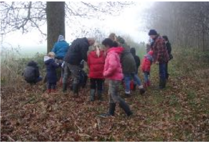
Met hulp van ouders trekt Frans Boschker de natuur in: ‘Somme kinderen vinden troost in de natuur’, weet hij.