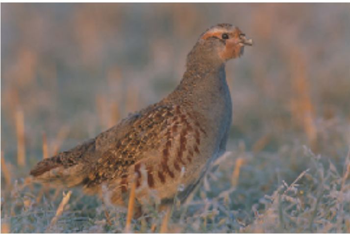
De patrijs keert terug in het Vragender landschap?